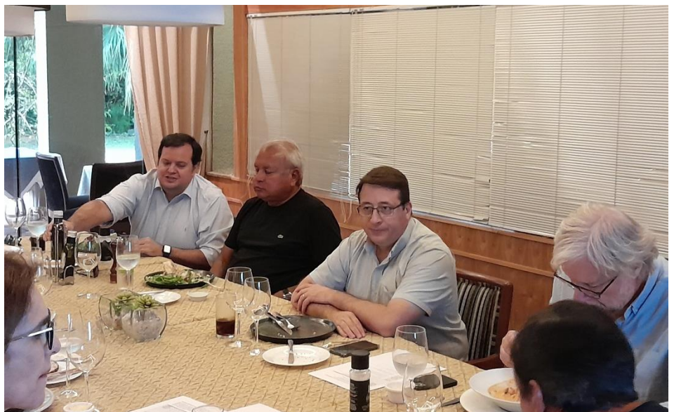
Martes 27 de febrero de 2024